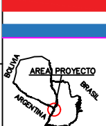
Lámina IE - 03 - RVO